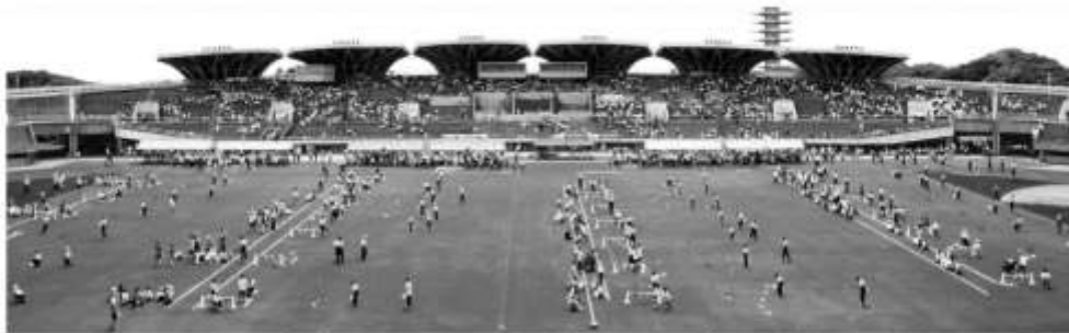
フライングディスクの聖地 駒沢オリンピック競技場・東京