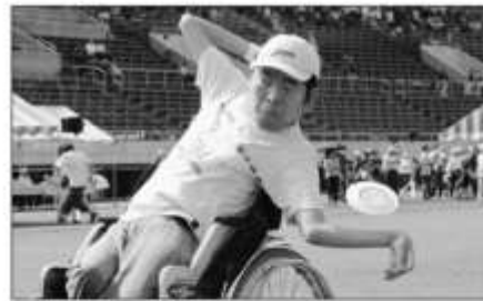
後ろ向きになって…